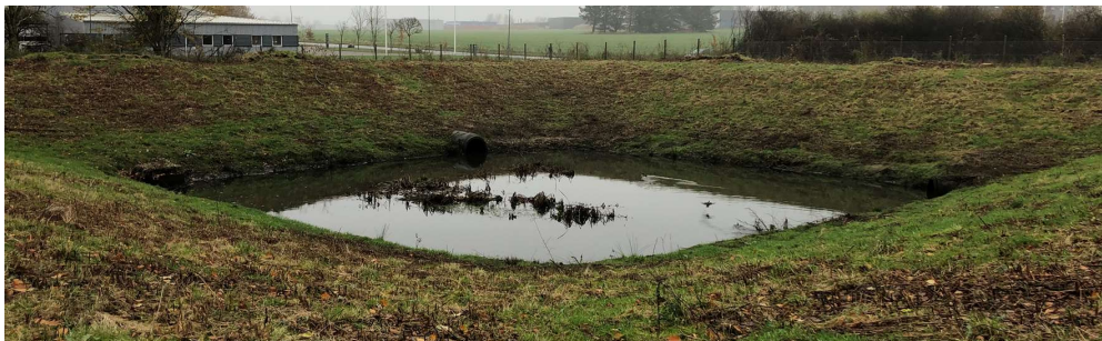
Foto af bassinet taget ved besøget.

Bassinet synes normalt at blive oprenset for sandaflejringer efter behov. Plantevæksten bestod af lidt lyse-siv, bredbladet dunhammer, dyndskræppe og en art vandstjerne. Vandet var grønt af algevækst, muligvis grønne flagellater eller andre alger, som foretrækker næringsrigt vand, og der sås en tynd kulbrintefilm på vandfladen. Miljøtilstanden i bassinet vurderes at være dårlig, og naturindholdet er formentligt til alle årstider ringe, selv om padder og vandfugle evt. kan yngle i det.