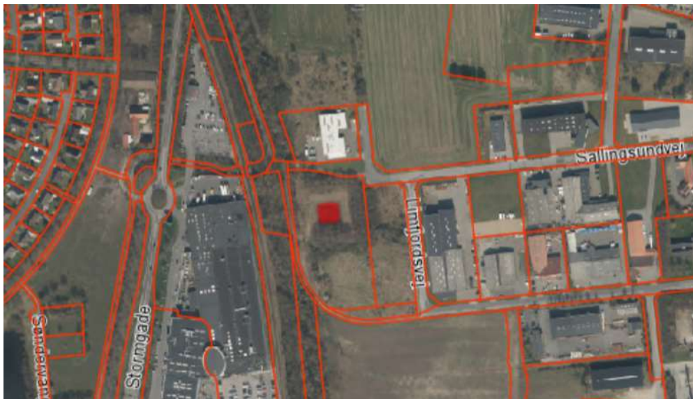
Bassinets placering (rødt kvadrat) på flyfoto fra 2019.

Du har søgt om dispensation til at udvide et beskyttet ca. 350 m 2 stort regnvandsbassin på matr.nr. 13ao, Gjesing By, Bryndum. Ejendommen ligger på Sallingsundvej i Esbjerg, og ejes af Esbjerg Kommune.